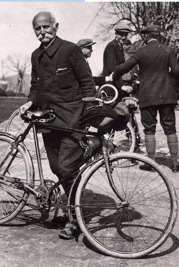
Paul de Vivie dit « Vélocio » en 1922.

À la Fédération, dans les clubs, les nombreux bénévoles œuvrent pour donner plus de chaleur, de fraternité et de simplicité à cette grande famille. Vélocio créa non seulement le néologisme mais aussi la philosophie du cyclotourisme.