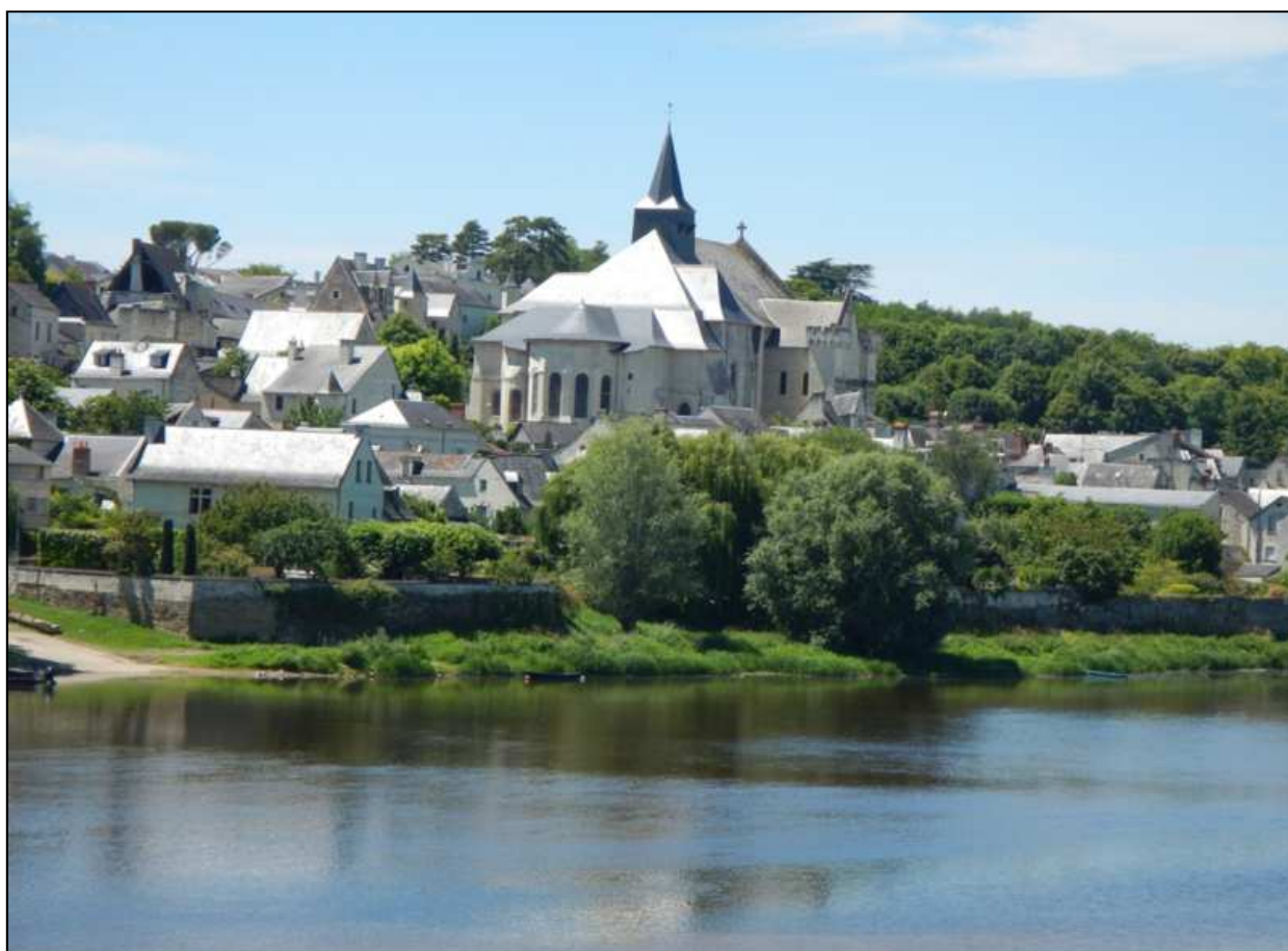
Candes-St-Martin, BPF d'Indre-et-Loire, Province de Touraine © A. Lardy.