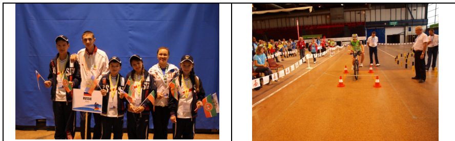
L'équipe de Russie, remporte le 26 e Concours européen d'éducation routière, organisé par la FFCT.

Samedi 17 septembre dernier, dans le cadre de la Semaine de la Mobilité, la Fédération française de cyclotourisme (FFCT) organisait le 26 e Concours européen d'éducation routière sous l'égide de la FIA et le haut patronage du ministère des Sports. 84 enfants de 10 à 12 ans issus de qualificatifs de 21 pays européens ont disputé la finale, en présence de Monsieur Jean Todt, président de la FIA, avec comme mot d'ordre : respect du Code de la route, maîtrise du vélo, savoir pratique et technique. Une journée d'épreuves bien remplie, dans une ambiance ludique et amicale.