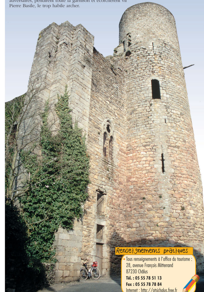
► Les vestiges du château Châlus-Maulmont

Pendant son agonie, ses hommes, fous de rage de voir le roi blessé, prennent le château dont, de nos jours, ne subsiste que le seul donjon, celui d'où partit le trait mortel. Avant de disparaître, inquiet pour son salut, le roi fit grâce à l'arbalétrier, mais dès qu'il eût trépassé, ses capitaines, qui ne pardonnaient pas la perte d'un tel employeur à leurs adversaires, pendirent toute la garnison et écorchèrent vif Pierre Basile, le trop habile archer.