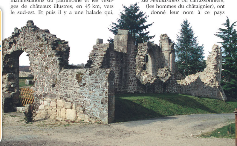
► Chapelles où se trouvaient les entrailles de Richard Cœur de Lion