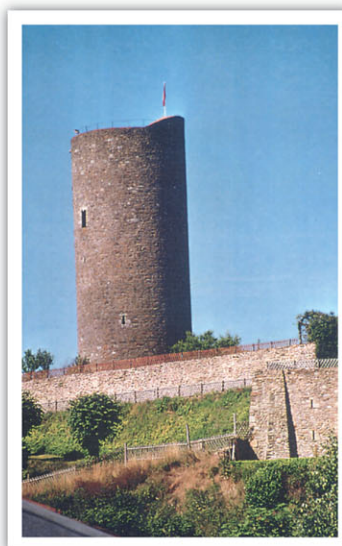
► La tour d'où fut tiré le carreau d'arbalète qui blessa mortellement le roi Richard

Ville essentiellement paysanne de longs siècles durant, elle en a, de nos jours, gardé le cachet dès que l'on quitte les limites de la cité. Entourée de hautes vallées et des Monts de Châlus, sa nature préservée, composée de vastes forêts, de rivières, d'étangs et de collines, attend les amoureux de calme et de vie authentique. D'ailleurs de nombreux circuits sont proposés aux cyclos qui voudraient s'attarder dans cette région du Limousin, la route Richard Cœur de Lion , par exemple, qui permet de découvrir 15 châteaux, églises ou cités qui jalonnaient et protégeaient le sud de la Vicomté au Moyen Âge. Le pays des bonnes fontaines 2 et des grands seigneurs , vous fera dénicher tour à tour d'humbles manifestations du patrimoine et les vestiges de châteaux illustres, en 45 km, vers le sud-est. Et puis il y a une balade qui,