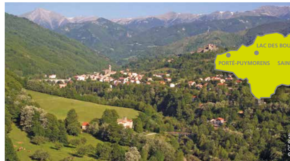
Prats-de-Mollo, tout en haut de la vallée du Tech.

Conflent-Capcir constitueront la province française du Roussillon.