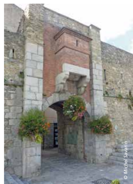
Une des quatre portes permettant l'accès.

C'est en 1345, qu'afin de protéger la population, une enceinte sera édifée et consolidée bien plus tard, en particulier suite... au tremblement de terre de 1428 ! Durant ce siècle furent également édifées des tours d'observation. La tour de Mir domine toujours la ville côté espagnol. Durant la guerre de Trente Ans, en 1635, la France et l'Espagne s'opposent. Les Catalans excédés par la politique de Madrid se révoltent et se mettent sous la protection du roi de France Louis XIII. Ce ne sera qu'en 1659 et à la signature du traité des Pyrénées que les comtés du Roussillon-Vallespir et