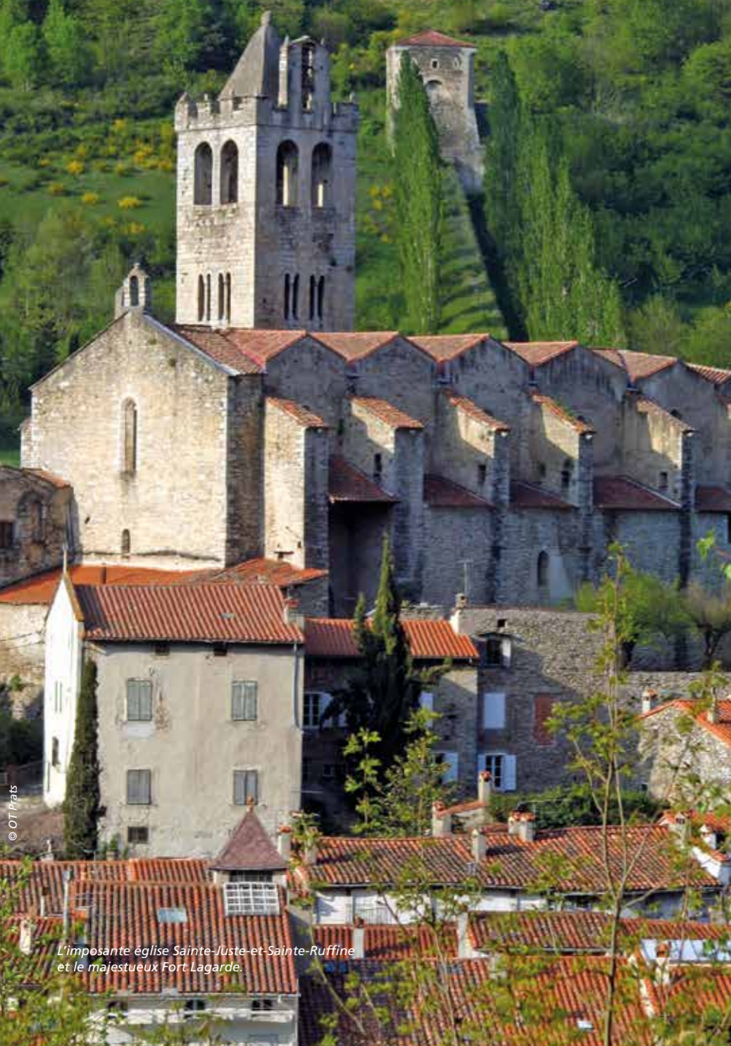
L'imposante église Sainte-Juste-et-Sainte-Ruffine et le majestueux Fort Lagarde.

Son nom est aussi long que la très belle vallée du Tech qui vous y conduira. Vous quitterez très vite la plaine du Roussillon avec le majestueux Canigou à votre droite pour atteindre ici les portes de l'Espagne proche.