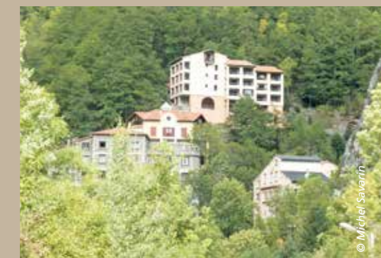
Tout là-haut, la station thermale.

Situé à 7 km du village, à 1 130 m d'altitude, le hameau de La Preste est devenu une station thermale de renom au niveau européen. Connue déjà au XVIII e , elle a été aménagée au long du siècle pour devenir aujourd'hui « la » station européenne de traitement, en particulier, des troubles urinaires. Quelque 2 500 curistes la fréquentent annuellement. À noter que Napoléon III voulait y venir, mais la guerre de 1870 l'en priva !