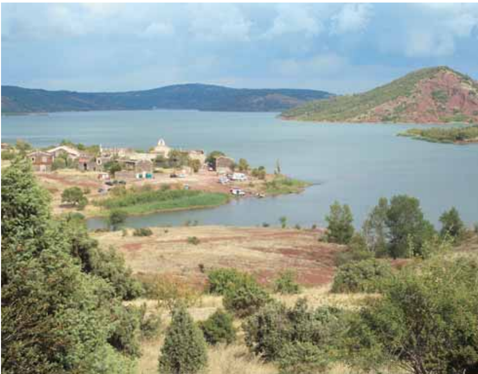
▲ Le Salagou, enchâssé dans les collines de grès lie de vin.