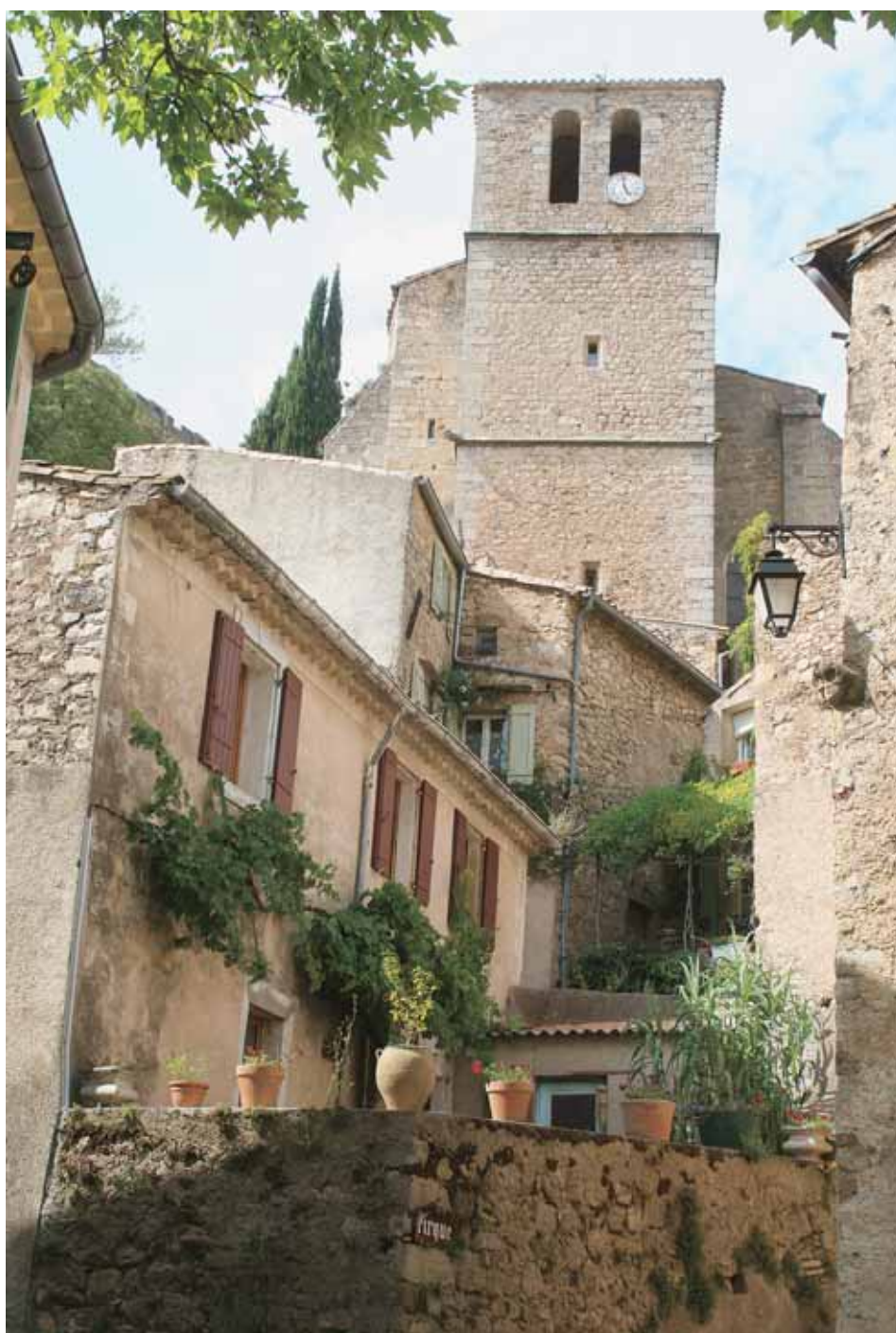
▲ Des maisons serrées autour du clocher.

Le village donne en effet sur un vaste amphithéâtre hérissé de roches dolomitiques, sur le versant sud du Mont Liausson. C'est un fantastique décor naturel modelé par l'érosion. Des centaines de colonnes d'un blanc éclatant se dressent parmi les thymes et les romarins, les genévriers, arbusiers et pins maritimes. Les pas des visiteurs ont créé un véritable dédale entre les piliers, les arches, les formes évoquant des animaux et personnages pétrifiés. Il est préférable de suivre l'un des circuits fléchés