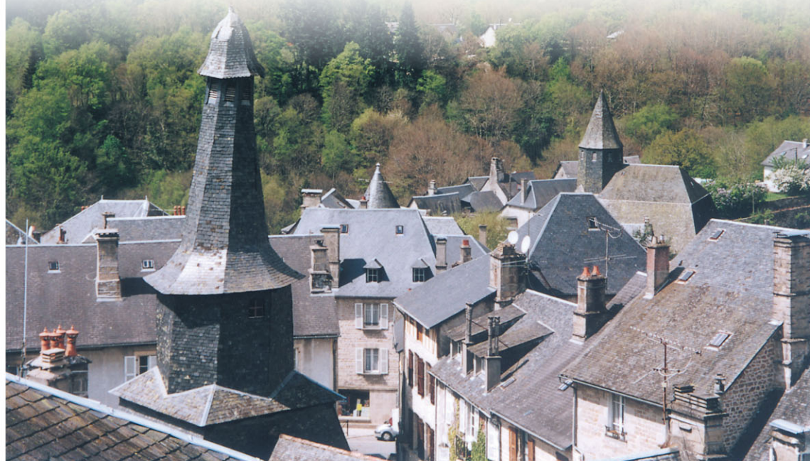
► Le village aux toits d'ardoise

D'apparence encore modeste, le cours d'eau réserve bien des surprises : après avoir pris sa source sur le plateau des Millevaches, la Vézère offre une grande diversité de parcours de canoë-kayak et, ce qui n'est pas très fréquent sur le Massif central, une bonne partie est navigable toute l'année grâce aux turbinages des usines hydroélectriques d'EDF.