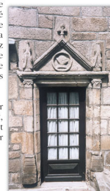
► Quelques sculptures originales

Devant nous, un édifice à l'élégant clocher tors a une histoire quelque peu mouvementée : cette ancienne chapelle Notre-Dame-de-la-Paix fut désacralisée à la Révolution pour devenir un Temple de la Raison, puis une simple mairie ; celle-ci devenant un peu exigüe, l'édifice n'est plus aujourd'hui qu'une salle municipale qui abrite de nombreuses réunions. Juste en face, l'ancienne halle aux grains qui a perdu deux de ses piliers en pierre de taille au fil de l'histoire, abrite la