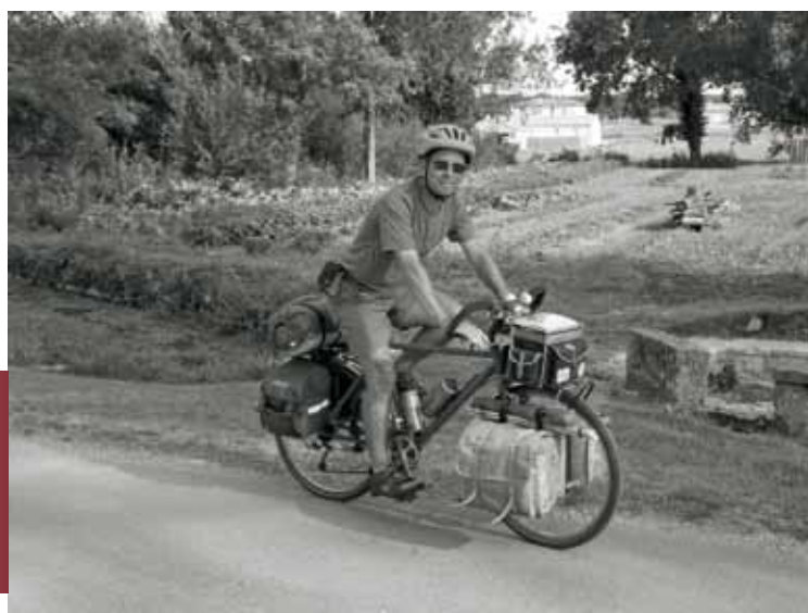
Photo bien composée, mettant en valeur un sujet se mouvant dans un décor de campagne anglaise.

Ambiance de cyclotourisme au long cours avec bonne maîtrise des clairs-obscurs.