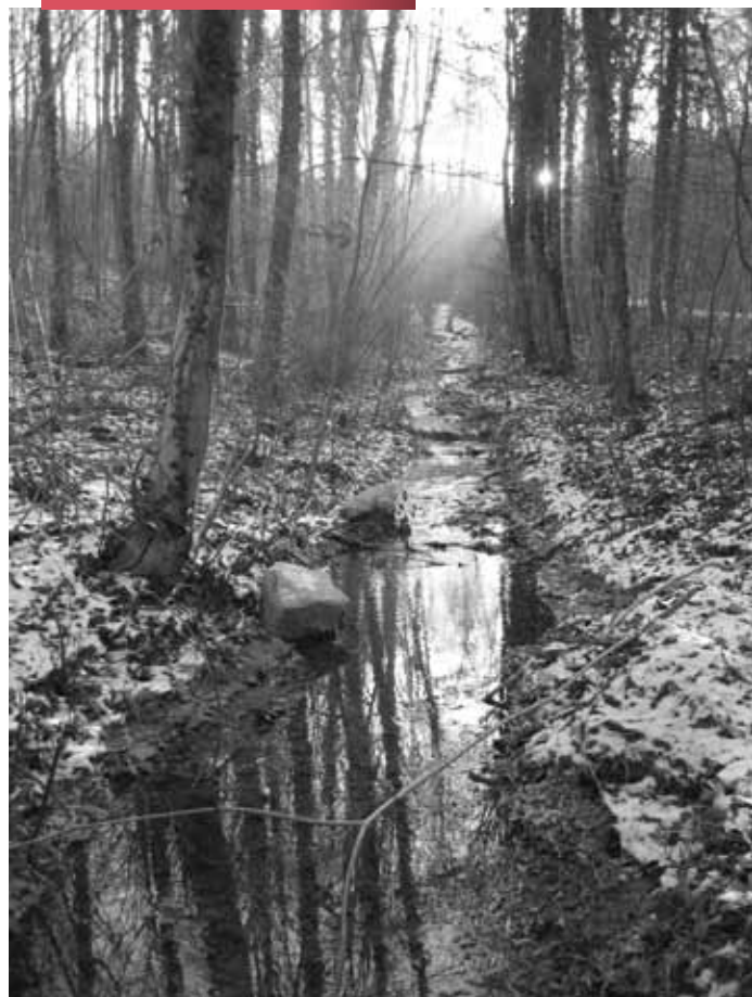
Photo classique, nette et bien cadrée ; belle dynamique des valeurs.

Ruisseau de la Fontaine royale à Commercy