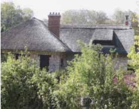
▲ Bourriche vendéenne, maison de Clémenceau.

* Brevet des provinces françaises: brevet permanent des plus beaux sites de France, organisé par la FFCT, avec parcours libre au choix du participant (voir Guide du cyclotouriste, pages 52-53).