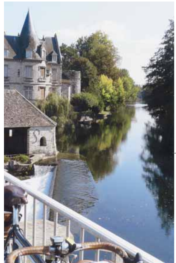
Les bords du Loing. ▲