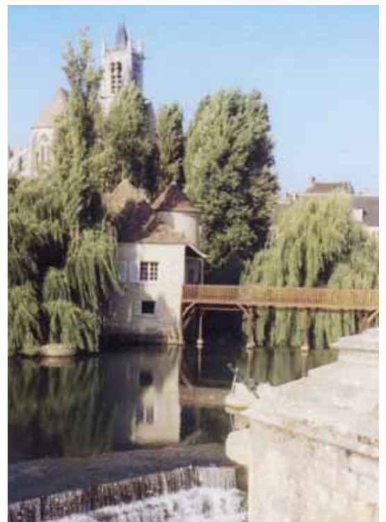
▲ Notre-Dame et le Loing.

En face, la Maison du bon saint Jacques portant une coquille visible sur la façade, témoigne du passage du chemin de Compostelle ; elle fut, entre 1822 et 1971, habitée par les sœurs de la charité qui vendaient le célèbre sucre d'orge de Moret. Non loin de là, dans la rue du Donjon, la