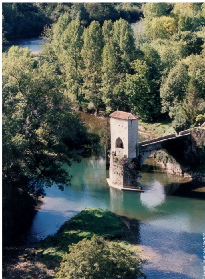
► Au bord du Gave, le Vieux Pont de la Légende.

Dans l'un des plus beaux paysages de France, les œuvres de l'homme y respirent la force et la noblesse parmi de splendides présents de la nature. Il n'y aura point de limites au rêve et à la méditation du touriste.