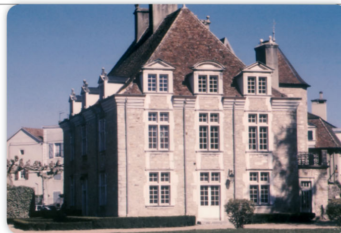
► Le château de Nays abrite aujourd'hui l'Hôtel de Ville

En 1462, Louis XI y séjourne brièvement alors que le bourg, avec son bon millier d'habitants, à peu près comme à l'heure