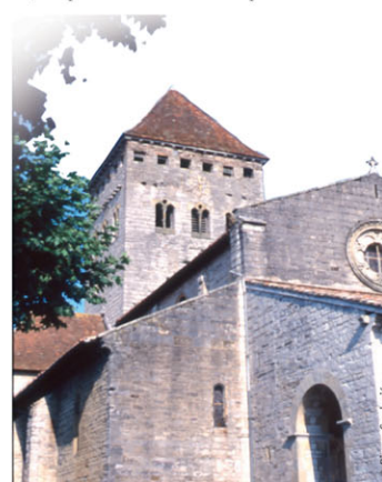
► L'église Saint-André avec son clocher de pierre

En flânant à travers les pittoresques ruelles, vous découvrirez, entre autres, le château dominé par les 33 m du Donjon de Montréal, l'église Saint-André érigée à la même époque où le gothique s'appuie sur des bases romanes. Son clocher carré surélevé d'un étage à créneau se voit du bout de l'horizon. Quant à son portail, il ne date, lui, que du XIX e . De la terrasse de cette église, le panorama est incomparable : du Pic