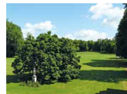
Un joli magnolia dans le parc.