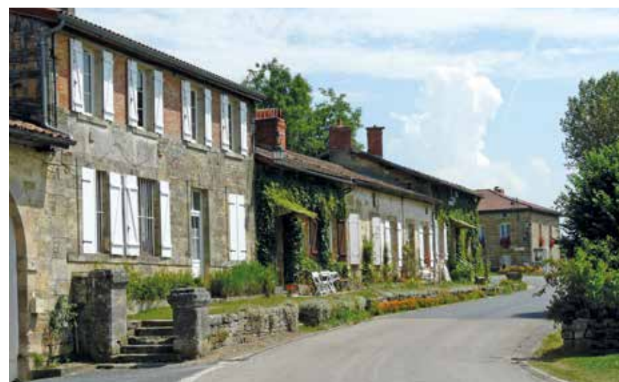
Rue principale de Trois-Fontaines.

par s'écrouler, entraînant dans leur chute une partie des murs. Le maître-autel en marbre rouge fut donné à l'église de Sermaize-les-Bains, un lutrin à celle de Cheminon et les grandes orgues à la collégiale de Vitry.