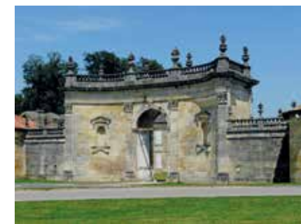
Porte d'entrée du château.