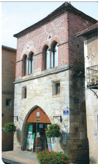
▲ La maison des Consuls abrite le syndicat d'initiatives

Cette place forte naturelle a été renforcée en contrebas au Moyen Âge, par la construction d'un château fort dont sub-