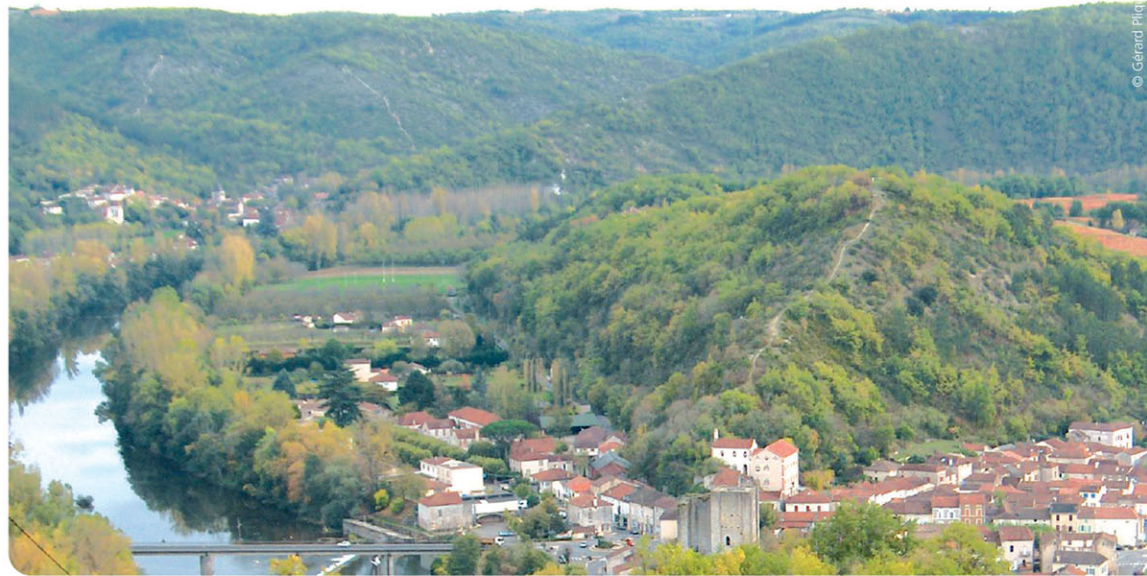
Luzech, le Lot et le promontoire de la Pistoule vus de l'Impenal.

musée Armand Viré où sont conservés les vestiges de l'Oppidum de l'Impenal. À l'extrémité de la boucle de la rivière, la chapelle Notre-Dame-de-l'Île, édifice gothique dédié aux marins du Lot est un lieu de pèlerinage depuis le XIII e siècle.