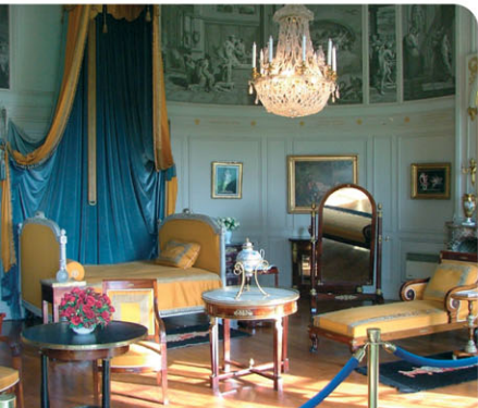
▲ La chambre de la belle duchesse de Dino, nièce et maîtresse

Bonaparte venait, en 1803, d'ouvrir le prestigieux livre d'or de Valençay.