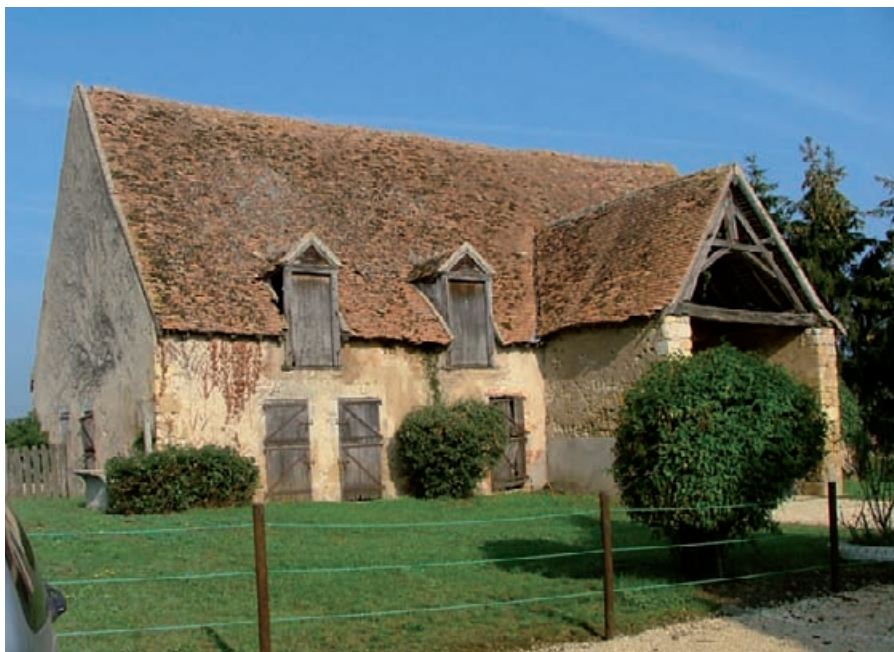
Ferme à auvent typique de la région