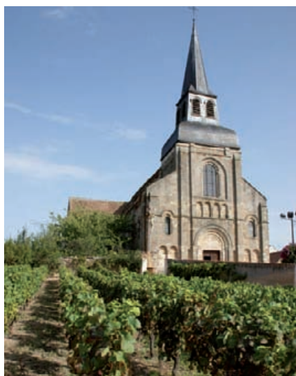
Église Saint-Genès et vignes du Seigneur