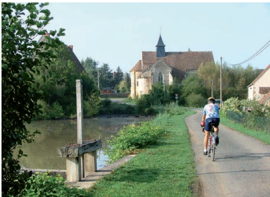
Le parcours paisible vers Saint-Jeanvrin

Châteaumeillant, nous l'avons dit, est un carrefour : première marche d'escalier qui conduit vers l'Auvergne, si l'on vient du Bassin Parisien, palier entre les ondulations mesurées du bassin ligérien et les reliefs bourbonnais et lyonnais plus prononcés. Ce peut être aussi un centre d'excursion bien situé car les alentours immédiats sont riches de belles choses. Culan et sa puissante forteresse féodale sont à une douzaine de kilomètres, le Sainte-Sévère de Jacques Tati à quatorze bornes, et pour en rester là, le « coup de cœur » : le minuscule bourg de Saint-Jeanvrin qui donnerait du talent au photographe le moins imaginaire, tant est agréable la vue sur la modeste église et la vieille tour, de part et d'autre d'un paisible étang dont une pittoresque vanne de bois est un premier plan incontournable ! ■