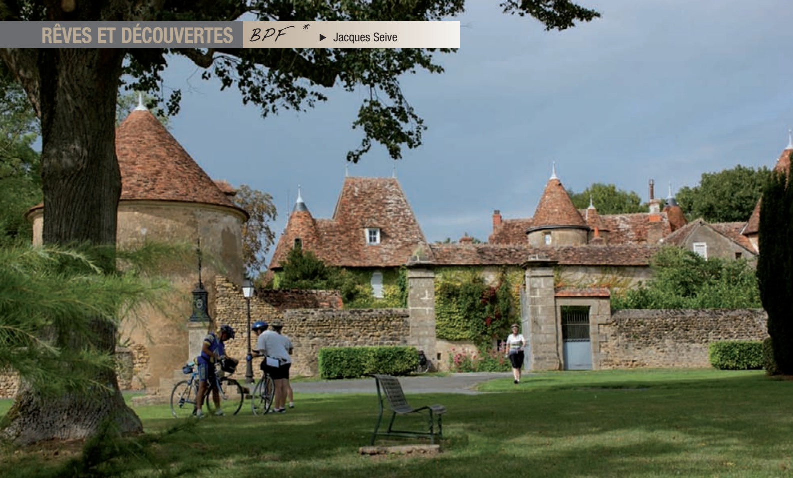
Montlevica, près de Châteaumeillant