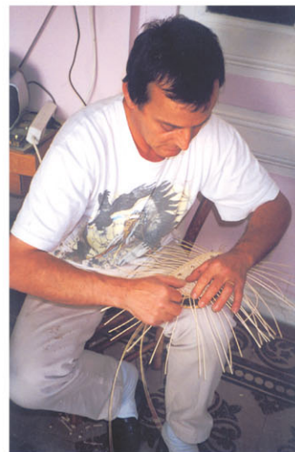
Le vannier aux doigts de fée

de la Loire, fut longtemps un obstacle aux communications mais aussi une protection contre les invasions barbares. Au Moyen Âge, Châtel-Montagne comptait dans les huit cents habitants. Le seigneur de l'époque protégeait ses serfs au château dont il ne reste que quelques ruines. Il y a eu à Châtel-Montagne une