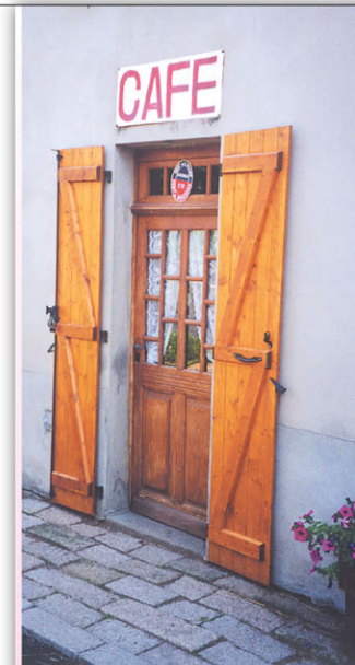
Une entrée sympathique au village de Chargueraud

* D'après Frédéric Noël - Légendes et traditions foréziennes .