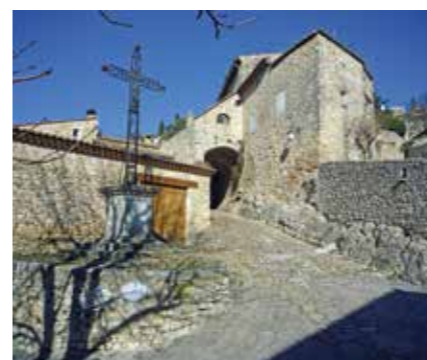
Le village aux calades pentues.