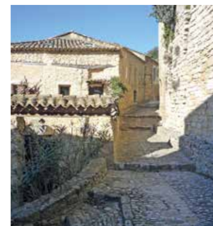
Une ruelle minérale difficile d'accès à vélo.