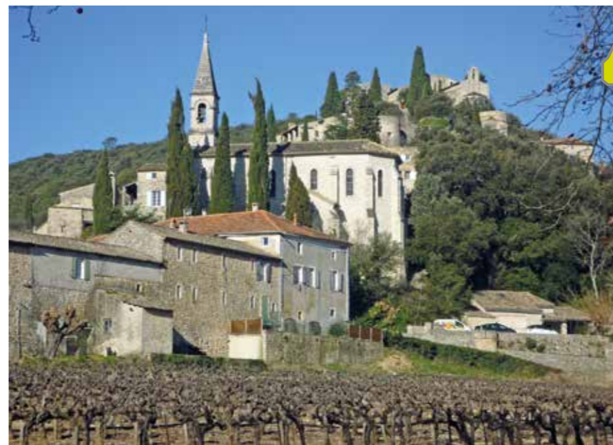
Au flanc de la colline, La Roque-sur-Cèze.

Dominé par les vestiges d'un ancien château et sa chapelle romane, le village aux calades pentues et maisons de pierres blondes à génoises offre une vue imprenable sur les cascades du Sautadet, ce site exceptionnel qui ajoute à l'attractivité du lieu. Et pourtant, on a du mal à le croire, dans les années 1950 la moitié haute du village était quasiment en ruine. Mais grâce à la volonté de quelques-uns, sa reconstruction débuta dans les années 1955-1960 pour aboutir au village tel que nous le connaissons aujourd'hui. N'espérez pas vous balader à vélo dans La Roque dont, comme nombre de sites ayant obtenu le label « Plus beau village de France », les rues sont étroites et pentues avec des pourcentages de qualité ; mais il serait dommage de ne pas monter jusqu'au sommet.