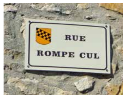
Une dénomination significative.

Et puis, feuillotez votre carte routière, La Roque n'est pas seulement un bonheur en elle-même, c'est également un excellent point central pour découvrir nombre de lieux plus charmants les uns que les autres : Goudargues et son canal, le paisible ermitage Notre-Dame-du-Saint-Sépulcre au nord de Cavillargues, la magnifique Chartreuse de Valbonne, datant du XIII e siècle, et, plus au nord, le si bel Aiguze surplombant l'Ardèche.