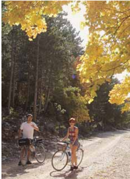
▲ Le charme de la route forestière.

Depuis la vallée du Toulourenc, près de Brantes, une route forestière non goudronnée s'élève jusqu'au col du Comte, à 1000 m d'altitude, et de là continue jusqu'au mont Serein. Un chemin forestier, depuis le pont de Saint-Léger, atteint le même point; la pente y est particulièrement rude. Un second, tracé voici seulement une vingtaine d'années débute à l'est de Malaucène, au lieu-dit les Maillets, et monte lui aussi au col du Comte. Un troisième, dit «route des Gravieres Blancs», part de Bédoin. Il atteint la «route des 1500 mètres», jadis goudronnée mais aujourd'hui en piteux état, qui prend un peu après le chalet Reynard et rejoint le lacet juste au-dessus du mont Serein. Elle permet de passer d'un versant à l'autre en évitant le sommet. Un accès officiellement réservé aux professionnels de la forêt monte depuis le versant sud. Routes et chemins forestiers font le bonheur des vététistes et offrent de splendides points de vue. Mais l'écosystème du massif du Ventoux est maintenant l'objet d'une protection et d'une réglementation sévères.