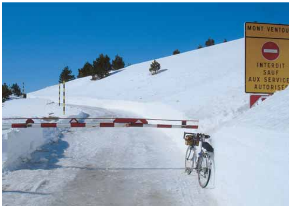
▲ Courageux ou téméraires ?