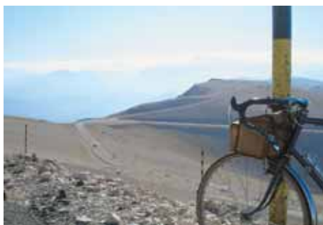
▲ La vue s'étend sans entrave.

Trois routes mènent au sommet. Celle du versant nord part du bourg de Malaucène (altitude: 377 m), passe peu après sous les frais ombrages de la source du Grozeau: à partir de là, on est seul avec son destin cycliste. Au bout de 15,5 km, à l'altitude de 1440 m, la route laisse à gauche le plateau du mont Serein; le sommet n'est plus qu'à 5,5 km, vous voyez en levant la tête la haute tour-relais de la télévision et les derniers lacets dans les cailloux. La route du versant sud part de Bédoin (275 m). Ce ne sont au début que pentes modérées, courbes trompeuses aux pourcentages qui ne veulent pas dire leur nom, dans les vignes et les cerisiers. On laisse ici et là quelques charmants hameaux, on passe devant la fontaine des