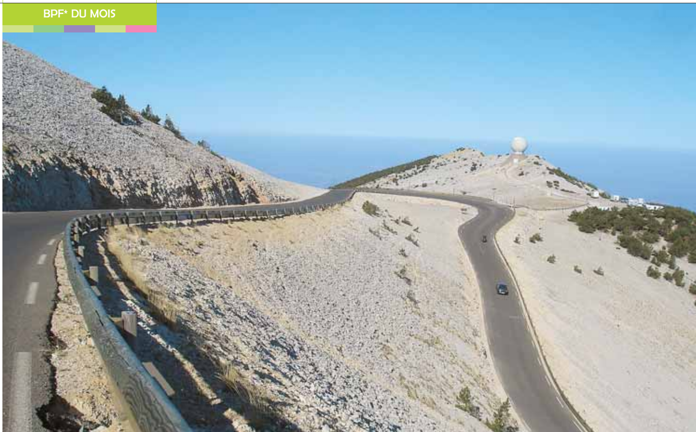
Des lacets dans la pierraille blanche. ▲