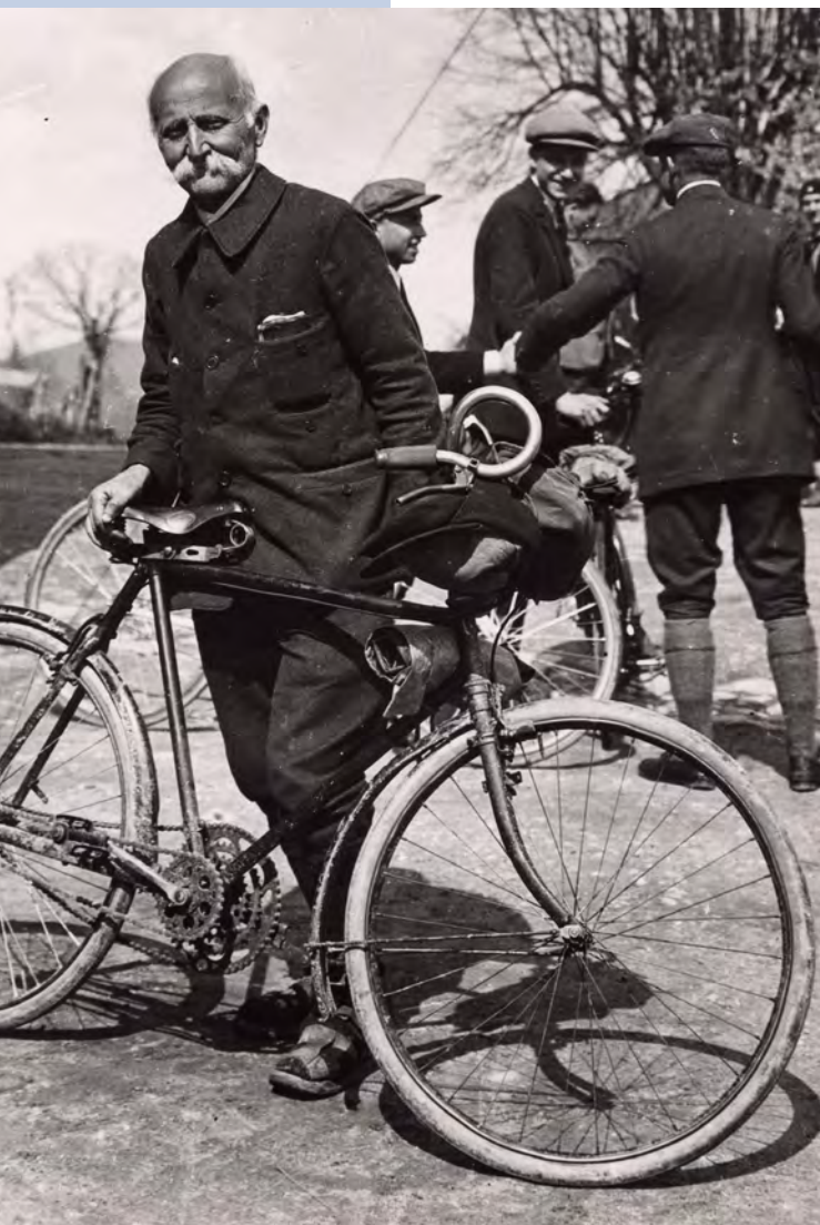
Paul de Vivie dit « Vélocio » en 1922.

À la Fédération, dans les clubs, les nombreux bénévoles œuvrent pour donner plus de chaleur, de fraternité et de simplicité à cette grande famille. Vélocio créa non seulement le néologisme mais aussi la philosophie du cyclotourisme.